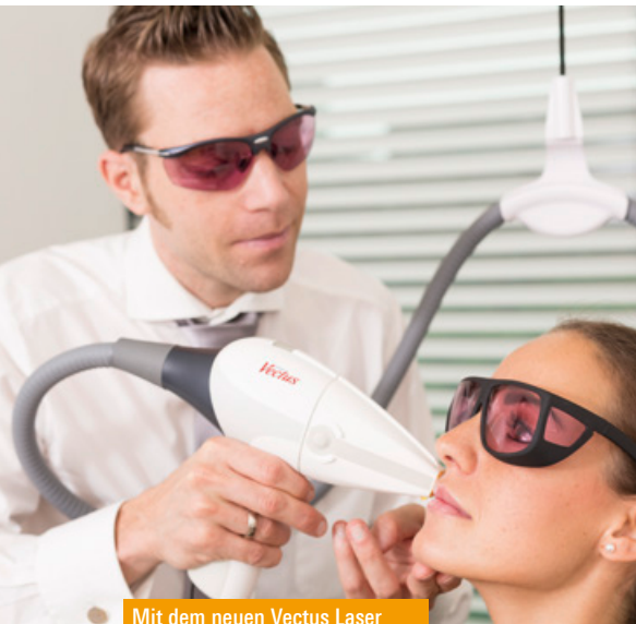
Mit dem neuen Vectus Laser lassen sich unerwünschte Haare nachhaltig entfernen.