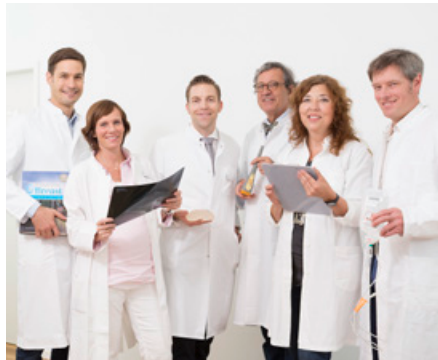
Das neu formierte Ärzteteam zur Versorgung von Brustkrebspatientinnen.